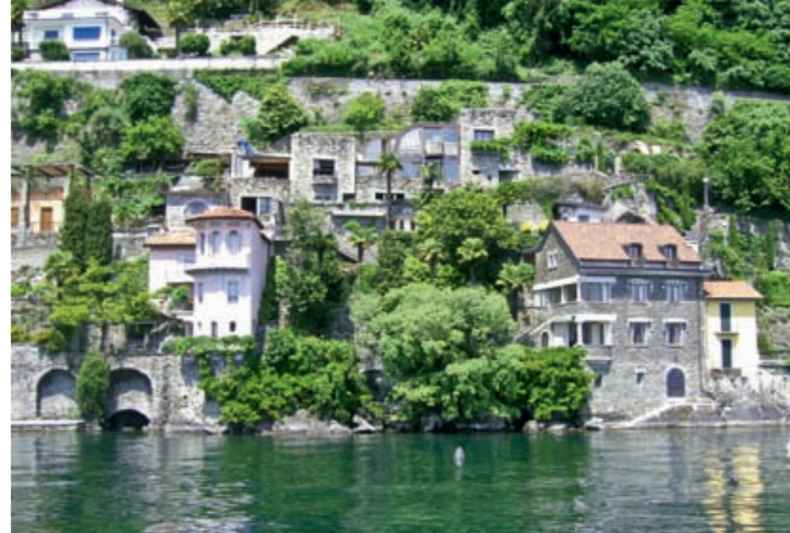
Vom Schiff aus kann man die Villen der Reichen und Schönen unterhalb der Uferstraße von Cannero sehen.