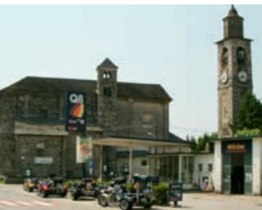
Boxenstopp mit Rauchpause und kurzem Getränkeverzehr auf dem Weg zum Lago d'Orta.

wurde natürlich ein Fotostopp eingelegt. Abschließend tuckerten wir mit unserem Krawallo noch durch die Uferpromenade von Cannobio.