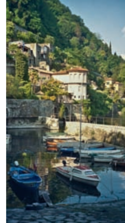
Der alte Fischerhafen von Cannero liegt versteckt in einer Seitengasse.