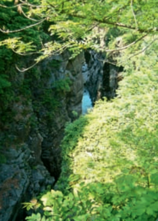
Zwischen steilen Felswänden schlängelt sich durch die „Schlucht von St. Anna“ der Fluss Cannobino. Oberhalb steht das kleine Kirchlein.