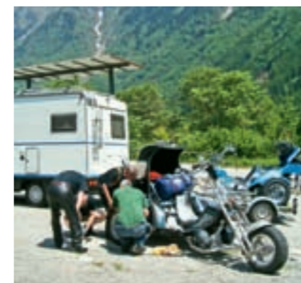
Improvisationstalent ist gefragt: Reparatur der Kotflügelhalterung an unserem Trike.

Immer nach der Devise „alles kann, was will“ stand für einige auch der Besuch der „Kiwibar“ am Strand oder ein abendlicher