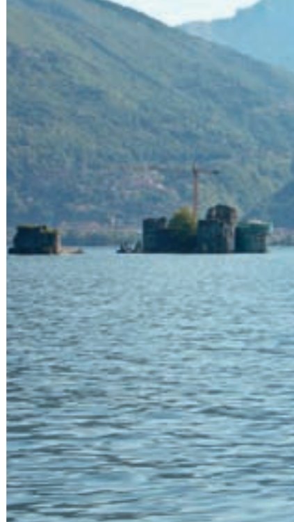
Blick auf die kleinen Inseln mit dem „Castelli di Cannero“.